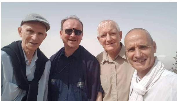
Les 4 évêques à Tibhirine