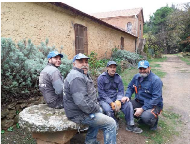
les ouvriers qui restaurent l'hôtellerie

On a aussi rénové l'intérieur de l'hôtellerie. Presque trois mois de travaux par une entreprise et le résultat en vaut la peine. On a pu ajouter deux douches, mettre l'eau chaude dans les chambres, reprendre l'électricité, la peinture, faire une bonne isolation. On pourra ainsi mieux accueillir les pèlerins et les retraitants, été comme hiver. On a été aidé pour ce chantier par la « Fondation des monastères ». J'en profite pour remercier ceux qui nous aident financièrement et vous partager aussi nos besoins de financement pour d'autres travaux à venir vraiment nécessaires.